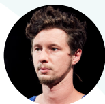
JORIS PESQUER Création et sélection de la bande-son